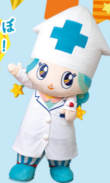
富山県薬剤師会 マスコットキャラクター 富薬(とみやく)ヒカリちゃん